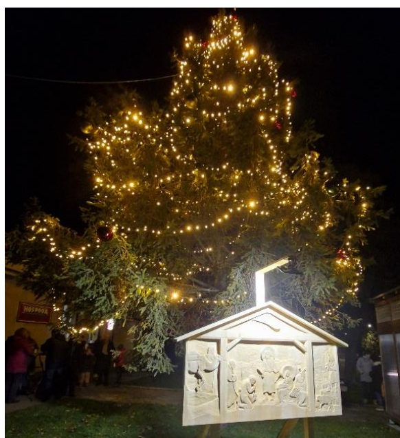
Nový betlém v Karlovicích