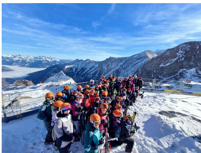
Žáci ZŠ na lyžařském kurzu v Alpách