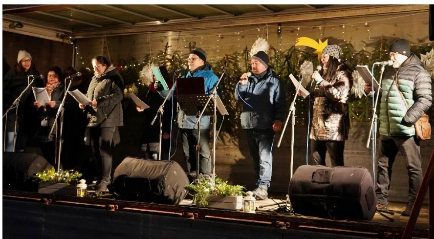
Rozsvěcení vánočního stroměčku provázal bohatý program.