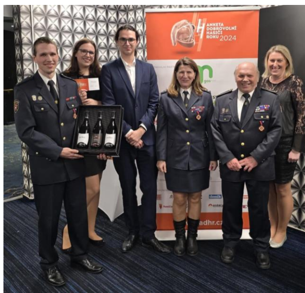
Ocenění členové SDH Karlovice