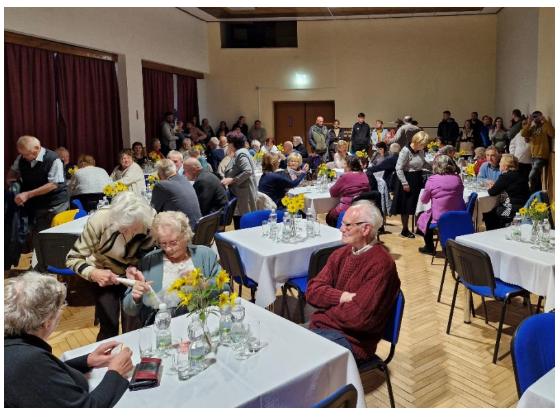
Oblíbené setkání seniorů

ZPRAVODAJ OBCE KOSTELEC U HOLEŠOVA A KARLOVICE